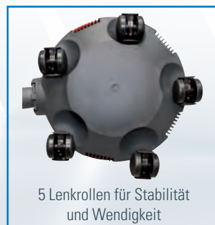
5 Lenkrollen für Stabilität und Wendigkeit