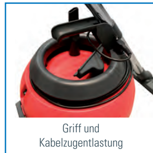
Griff und Kabelzugentlastung