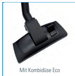
Mit Kombidüse Eco